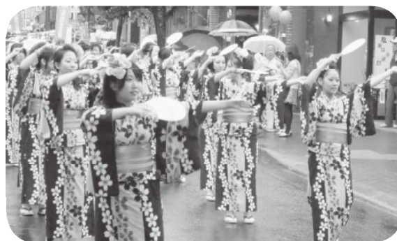
7月25日 潮まつり本番!!