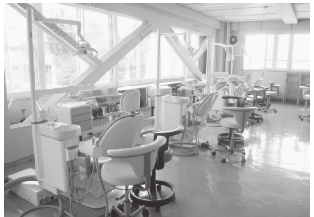
母校 実習室 (3F)