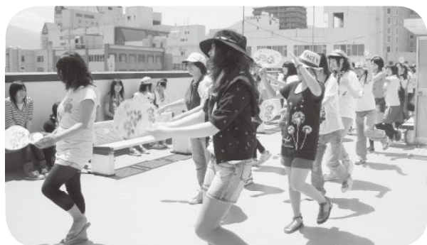
6月末ハイキング出発前に初練習